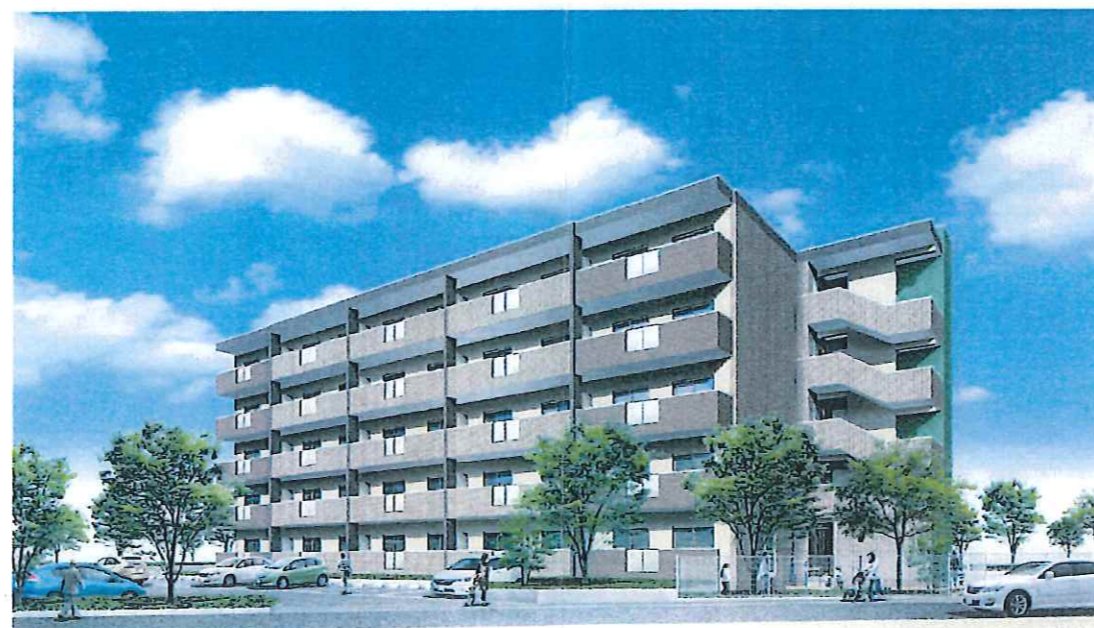
外観透視図(目線図)