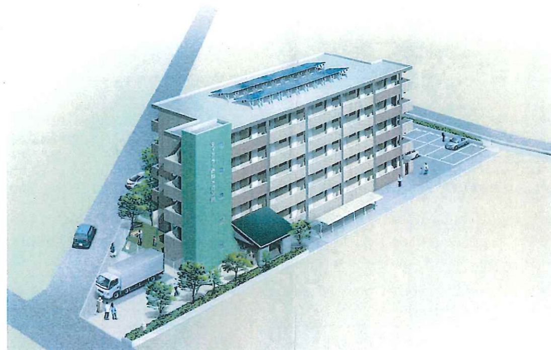
外観透視図(目線図)