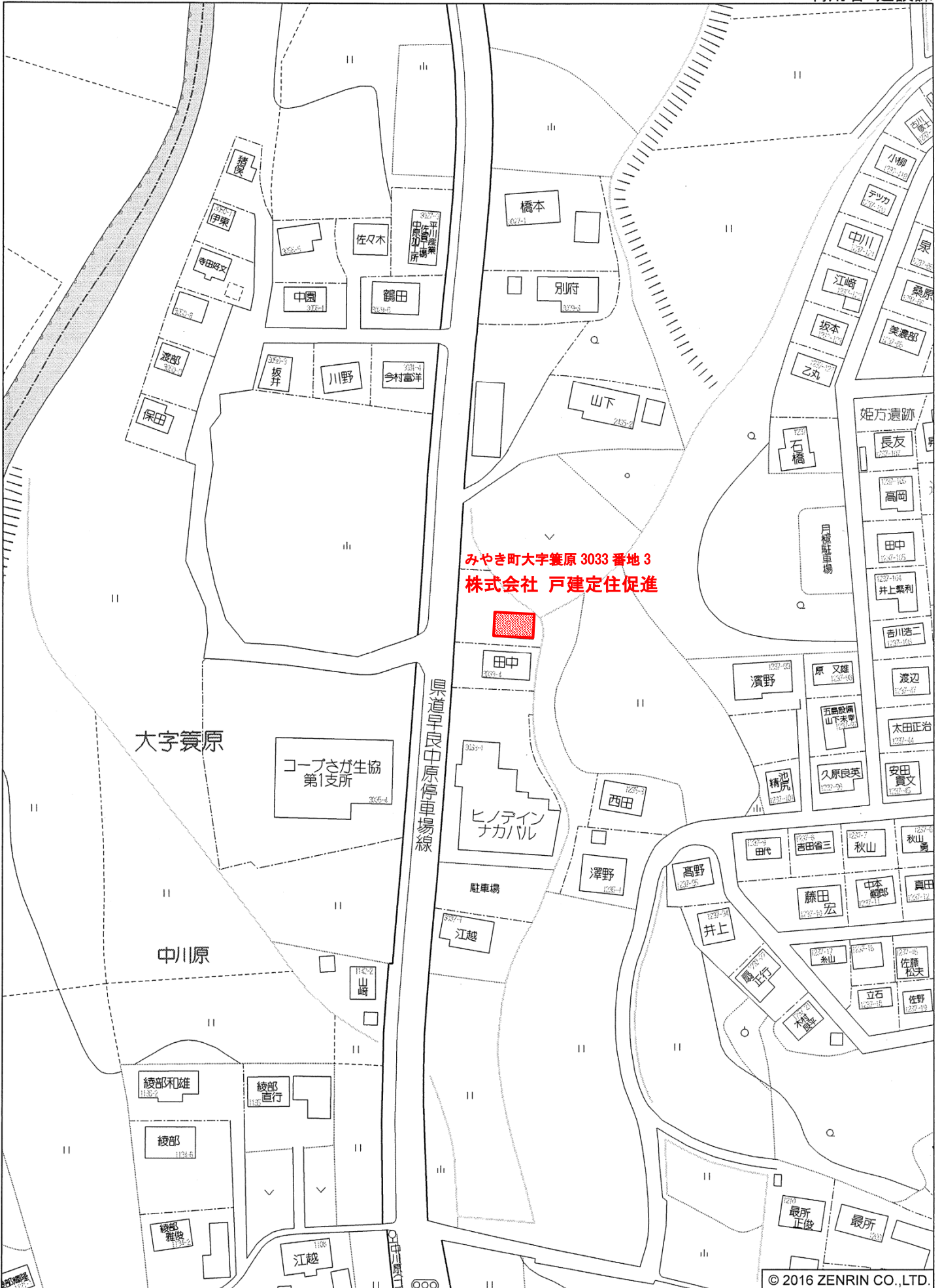
みやき町大字箕原付近