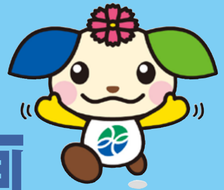
みやき町イメージキャラクター みやっきー