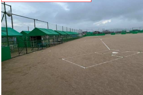
競技会場（白石町総合運動場）