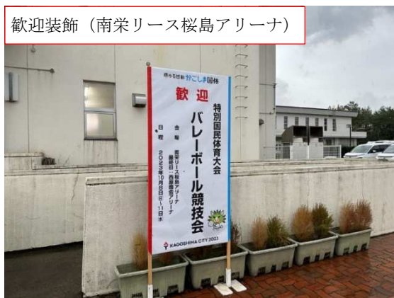
歓迎装飾（南栄リース桜島アリーナ）