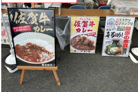
売店（白石町総合運動場）