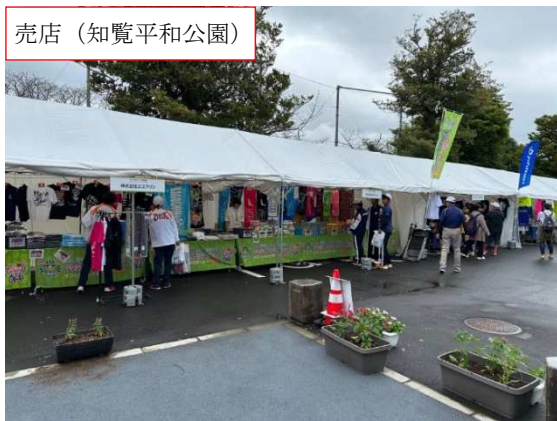
売店（知覧平和公園）