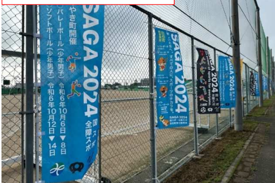
会場装飾（白石町総合運動場）