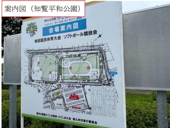
案内図（知覧平和公園）