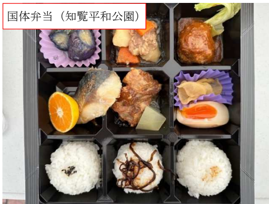
国体弁当（知覧平和公園）