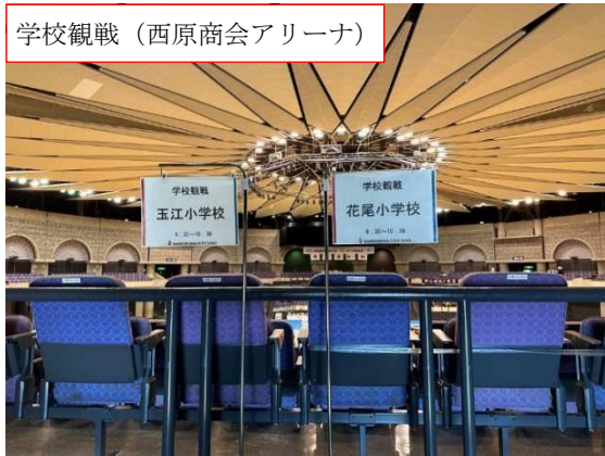
学校観戦（西原商会アリーナ）