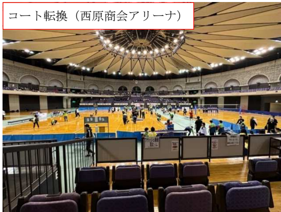
コート転換（西原商会アリーナ）