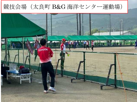
競技会場 (太良町 B&G 海洋センター運動場)