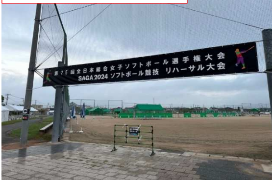
大会名看板（白石町総合運動場）