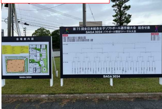
会場案内等（白石町総合運動場）