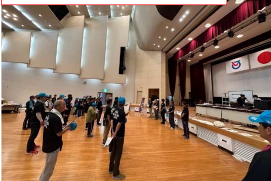
実施本部打ち合わせ（白石町総合運動場）