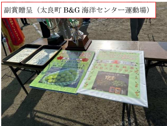
副賞贈呈 (太良町 B&G 海洋センター運動場)