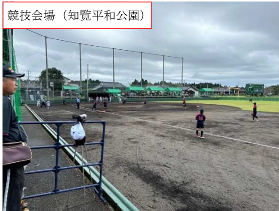
競技会場（知覧平和公園）