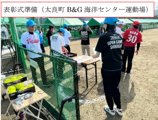
表彰式準備 (太良町 B&G 海洋センター運動場)