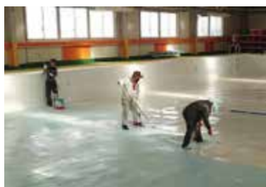
B&Gプール、塗装の塗り直し

有識者と建設業者・ 塗料メーカー及び設 計業者等で調整会議 を行っており、新た な工法についても検 証が必要のため、し っかり協議をさせて いただく。