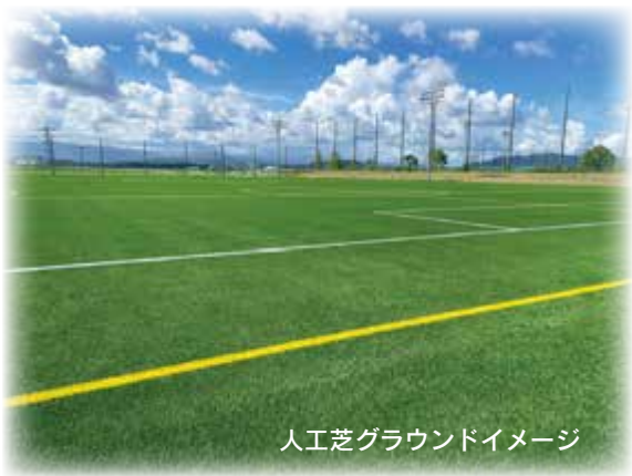
人工芝グラウンドイメージ

債務負担行為 ※ として、多目 的グラウンド整備に限度額9億 4166万1千円が計上されま した。