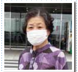
町内在住の70代女性