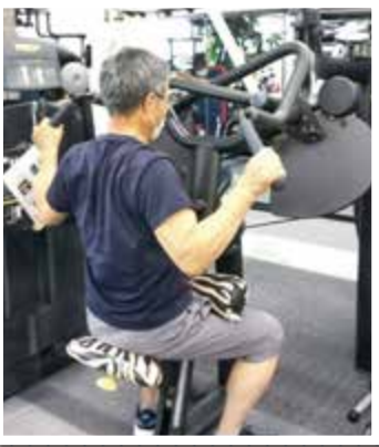
定年後に宮崎県から移住された70代男性