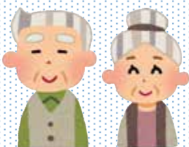
トマト館にお住まいのご夫妻