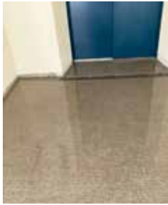
4階エレベーター前 全面水たまり

・退去時、高額な「改修費請求」があると聞く 入居時の点検確認は必須基準の周知を。 答 寄せられている苦情箇所はしっかり対応していきたい。