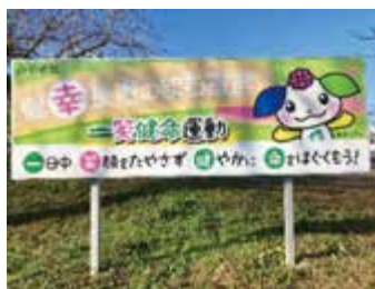
健康長寿のまち宣言

問 带状疱疹を発症する高齢者が急増している。ワクチン接種で予防できるが自己負担で4万円、町民には大きなハードル。現時点で190自治体が公費助成導入。本町も費用助成ができないか、及び現在の国の検討状況、佐賀県内での助成状況を伺う。