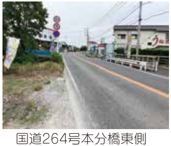
国道264号本分橋東側

答 当初U15でスタートし、現在は幼児から社会人まで計53名。活動の目的としては、町の地方創生プロジェクトの中心に女子サッカーを位置づけ、女子サッカーを核としたスポーツによるまちづくりにより町全体を活性化していく。将来はトップリーグ参入を目指す。