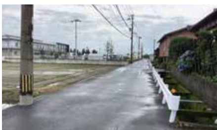
メディカルコミュニティセンター西側町道

北茂安運動広場の 代替地については、 メディカルコミュニ ティセンター北側の 2筆の用地を相談し ているが同意を得る