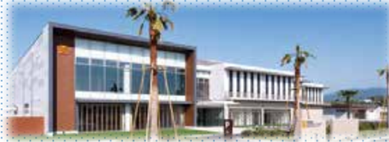
市村記念メディカルコミュニティセンター