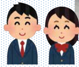
通学支援バスを待っていた高校生