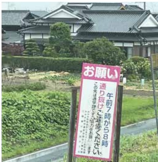
筑後川堤防から土井内区への降り口

ら来る車が東分の国道264号合流での混雑を避けるため、途中で土井内区集落に降り、三根東小学校の東門前を通り東分の押しボタン信号より久留米方面に行っている。通勤時間帯と通学時間が拮抗しており大変危険である。このことについて対応できないかお尋ねする。