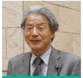
みやはら ひろのり 議員 宮原 宏典