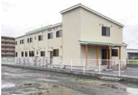
整備中のグループホーム