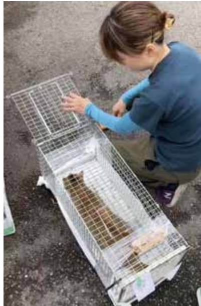
手術を終え地域に帰るネコ