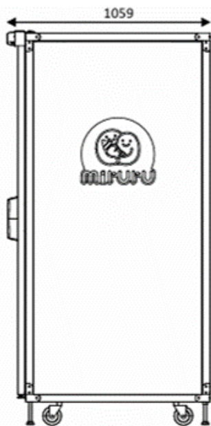
【 側 面 】