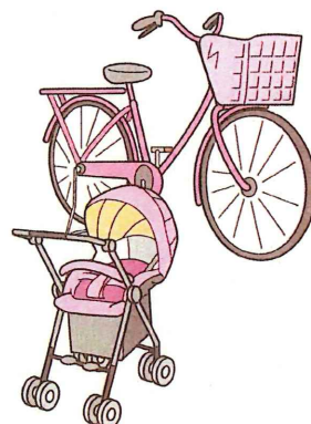
自転車、ベビーカー